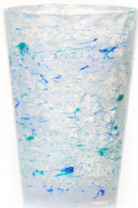
BLUE Bicchiere / Glass Ø 8,5 H 12 cm Cod. MMLBDGB