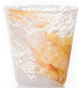
PASTEL SUNSET Bicchiera / Glass Ø 8,5 H 9,5 cm Cod. MPSUDG