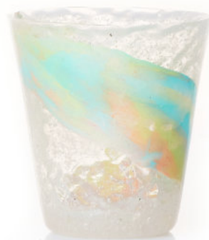
PASTEL DAWN Bicchiera / Glass Ø 8,5 H 9,5 cm Cod. MPDDGG