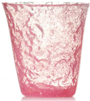
FUCHSIA Bicchiere / Glass Ø 8,5 H 9,5 cm Cod. MMFDG