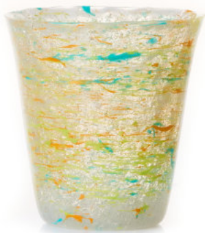
ORANGE / BLUE Bicchiere / Glass Ø 8,5 H 9,5 cm Cod. MMLOBDG