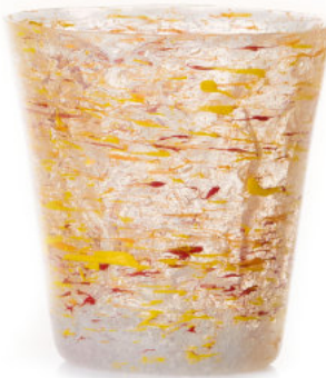
RED / ORANGE Bicchiere / Glass Ø 8,5 H 9,5 cm Cod. MMLRODG