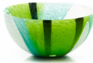
GREEN Coppetta / Cup Ø 12 H 6 cm Cod. MGICC