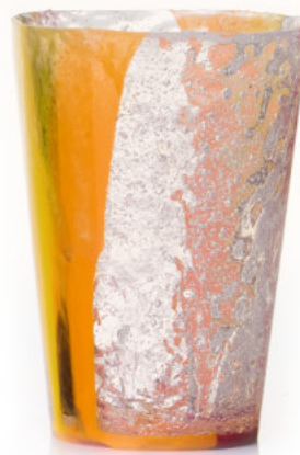
ORANGE & BURGUNDY Bicchiera / Glass Ø 8,5 H 12 cm Cod. MBRNDGB