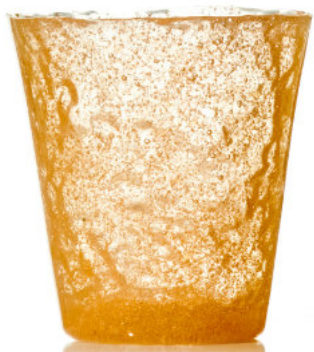
ORANGE Bicchiere / Glass Ø 8,5 H 9,5 cm Cod. MMODG