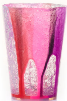
FUCHSIA & RED Bicchiera / Glass Ø 8,5 H 12 cm Cod. MRDGB