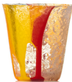
ORANGE & BURGUNDY Bicchiere / Glass Ø 8,5 H 9,5 cm Cod. MBRNDG