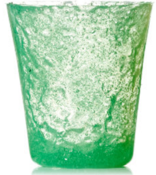
GREEN Bicchiere / Glass Ø 8,5 H 9,5 cm Cod. MMGDG