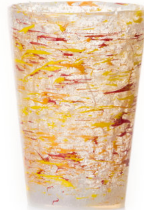
RED / ORANGE Bicchiere / Glass Ø 8,5 H 12 cm Cod. MMLRODGB