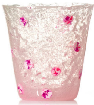
FUCHSIA Bicchiere / Glass Ø 8,5 H 9,5 cm Cod. MUMFDG