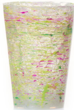
GREEN / PURPLE Bicchiere / Glass Ø 8,5 H 12 cm Cod. MMLGPDGB