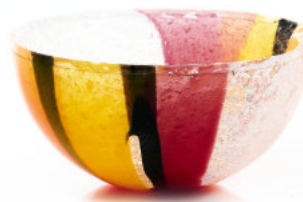
ORANGE & BURGUNDY Coppetta / Cup Ø 12 H 6 cm Cod. MOBICC