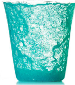
BLUE Bicchiere / Glass Ø 8,5 H 9,5 cm Cod. MMBDG