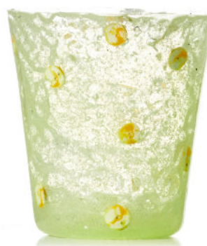
YELLOW Bicchiere / Glass Ø 8,5 H 9,5 cm Cod. MUMGDG