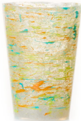
ORANGE / BLUE Bicchiere / Glass Ø 8,5 H 12 cm Cod. MMLOBDGB