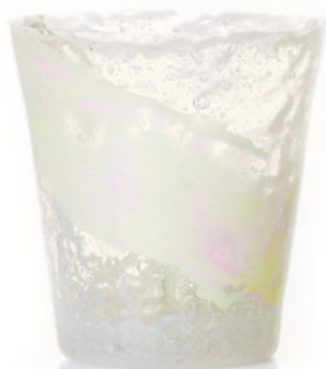
PASTEL SOFT Bicchiera / Glass Ø 8,5 H 9,5 cm Cod. MPSDGG