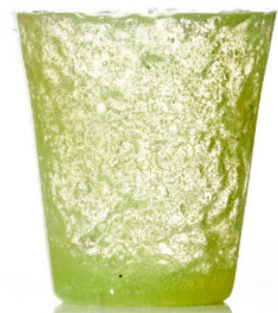
YELLOW Bicchiere / Glass Ø 8,5 H 9,5 cm Cod. MMYDG