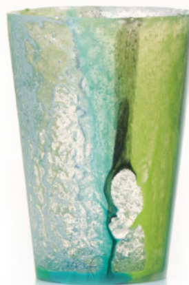
GREEN Bicchiera / Glass Ø 8,5 H 12 cm Cod. MGDGB