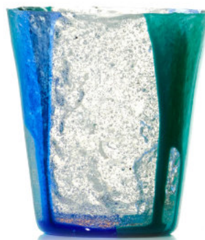
BLUE Bicchiere / Glass Ø 8,5 H 9,5 cm Cod. MBDG