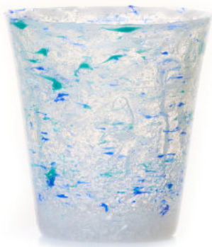
BLUE Bicchiere / Glass Ø 8,5 H 9,5 cm Cod. MMLBDG