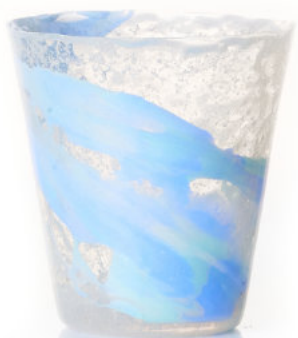
PASTEL SKY Bicchiera / Glass Ø 8,5 H 9,5 cm Cod. MPSKDG