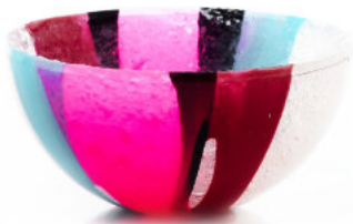
MULTI Coppetta / Cup Ø 12 H 6 cm Cod. MMICC