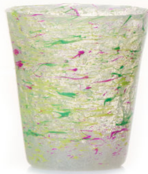
GREEN / PURPLE Bicchiere / Glass Ø 8,5 H 9,5 cm Cod. MMLGPDG