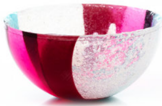
FUCHSIA & RED Coppetta / Cup Ø 12 H 6 cm Cod. MFICC