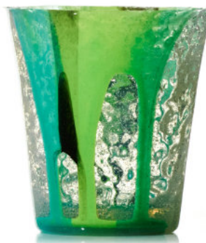
GREEN Bicchiere / Glass Ø 8,5 H 9,5 cm Cod. MGDG