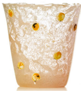
ORANGE Bicchiere / Glass Ø 8,5 H 9,5 cm Cod. MUMODG