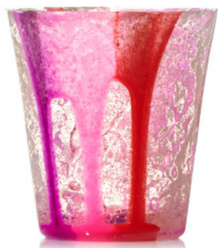
FUCHSIA & RED Bicchiere / Glass Ø 8,5 H 9,5 cm Cod. MRDG