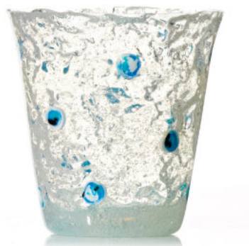
BLUE Bicchiere / Glass Ø 8,5 H 9,5 cm Cod. MUMBDG