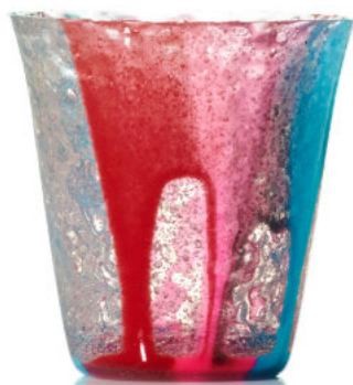
MULTI Bicchiere / Glass Ø 8,5 H 9,5 cm Cod. MMDG