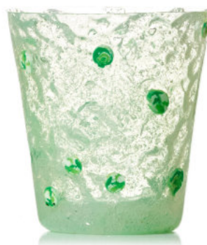
GREEN Bicchiere / Glass Ø 8,5 H 9,5 cm Cod. MUMGDG