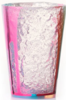
MULTI Bicchiera / Glass Ø 8,5 H 12 cm Cod. MMDGB