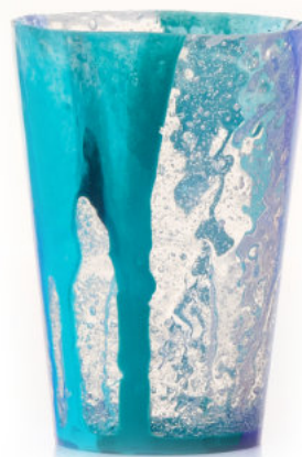
BLUE Bicchiera / Glass Ø 8,5 H 12 cm Cod. MBDGB