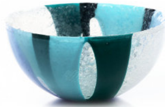
BLUE Coppetta / Cup Ø 12 H 6 cm Cod. MBICC